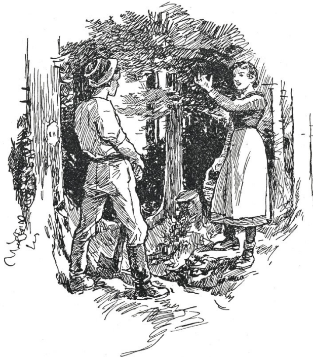
Lachend zeigte es ihm den schmalen Goldreif am Finger.

„Walter, wie gehts dem Vater?“ Beinahe hätte er sich in den Fuss hineingehauen. So erschrak er ob dieser Stimme. Im Ruck schaute er um sich und sah sein Agathli mit einem Körbchen neben dem Waldweg stehen. „Besser gehts dem Vater, und Dir scheint auch gut zu gehen. Du siehst aus wie ein Hagröseli, zart und rosarot.“ „Und Du siehst aus wie ein Fremdenlegionär so sonnenverbrannt und zählederig.“ „Das ist nur der erste Eindruck, Du wirst sehen, der zweite Eindruck ist besser. Komm, fühl einmal, was ich für eine seidenweiche Haut an der Backe habe.“ „Ja Du, mit Deinen Stoppelbart!“