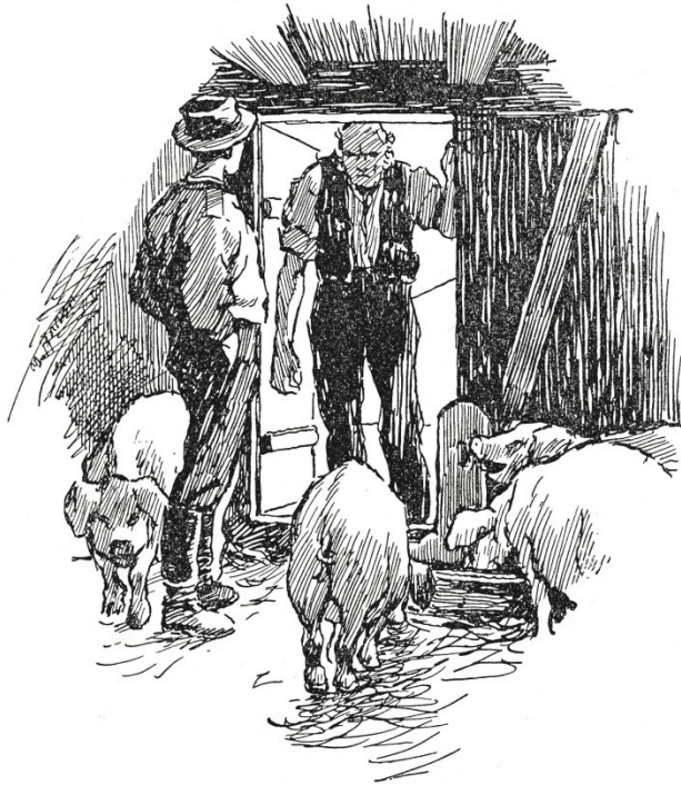
Im Türrahmen stand der Vater.

Agathli wusste von der Unterredung im Saustall nichts. Es hatte viel nach Walter Ausschau gehalten. Die nächsten paar Tage war er nicht gekommen. Das war nicht verwunderlich. Jeden Morgen dachte es: „Heute muss er kommen. Und wenn er nicht wegen dem Ross kommt oder um zu arbeiten, dann kommt er am Abend.“ Und immer wieder wurde es Nacht ohne Walter. Agathli trällerte und sang weniger, verlor den Übermut, schaute oft traumverloren aus dem Fenster oder in einen Winkel hinein.