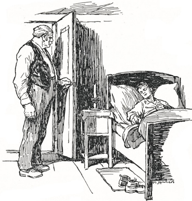
Da lag seines Bruders Sohn im Bett.

Der Ratsherr wollte ihn wecken. Einen Augenblick blieb er stehen und betrachtete das friedliche Bild; dann kam ein weher, harter Zug in sein Gesicht. Sein Mund verschloss sich zu einem schmalen Strich und die Augen wurden trüb. Ganz leise sprach der Ratsherr zwischen den verbissenen Zähnen hervor: „In dem Alter und ungefähr so einer wäre jetzt mein Bub, wenn er nicht gestorben wäre, damals vor zwanzig Jahren.“ Er trat einen Schritt näher, fuhr mit seiner Faust aus der Hosentasche und gegen den Schläfer zu. Im