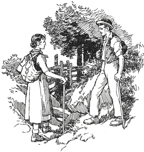
Und beim Zusammentreffen tat er noch so erstaunt.