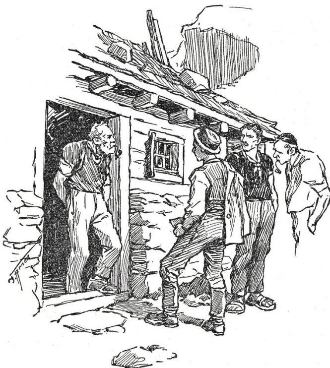
Die Älpler hörten ihm zu, schüttelten die Köpfe, und liessen ihn stehen.

Und doch brachte der Friedl aus sechs Hütten vier Mannen auf die Beine, die hinter ihm nach über den Grat unter den hohen Felsen hinüber kamen und dort hinaufstarrten. Sie redeten nicht viel. Auf dem Heimweg sagte einer zum andern, just so laut, dass es der Friedl hören konnte: „Schon vor uns haben berggewohnte Älpler und gescheite Bauern an dem Wassermangel hier auf der Stöckli-Alp herumstudiert, klügere Leute als wir selber sind und als meistens im Dorf unten umeinanderlaufen. Aber einen so verrückten, kostspieligen Vorschlag hätte doch noch keiner gewagt zum Maul hinaus zu lassen.“ „Ja aber, das Wasser in dem Bächlein ist gut“, sagte Friedl, „Ihr habts doch probiert.“ „Ja, das schon.“ „Und wenns dann in Eurer Alp zur Röhre herausrinnt, dann ist es dann auch gut, oder