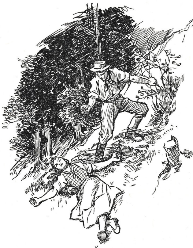
Friedl war in zwei Sprüngen bei ihm.

ist es im Tal zu leben“, sagte der Friedl, „da unter der frostigen Decke liegt das Dorf, wohnen Menschen, streiten sich, plagen sich, müssen ja dort unten grau und gehässig werden. Ich möchte immer hier oben, irgendwie in den Bergen sein. Im harten, eisigen Sturm, im Schneetreiben, das einem den Atem nimmt, gefällt es mir besser als in einer geheizten Talstube. Und erst wenn die Sonne glüht und leuchtet und Ruhe und Frieden mir bis zu innerst hinein wohl tun, so wie jetzt.“ Friedl kam ins Plaudern, ins Träumen hinein, von seinen Bergen sprach er, von seiner Liebe zu dieser herrlichen Bergheimat, von seiner schmerzlichen