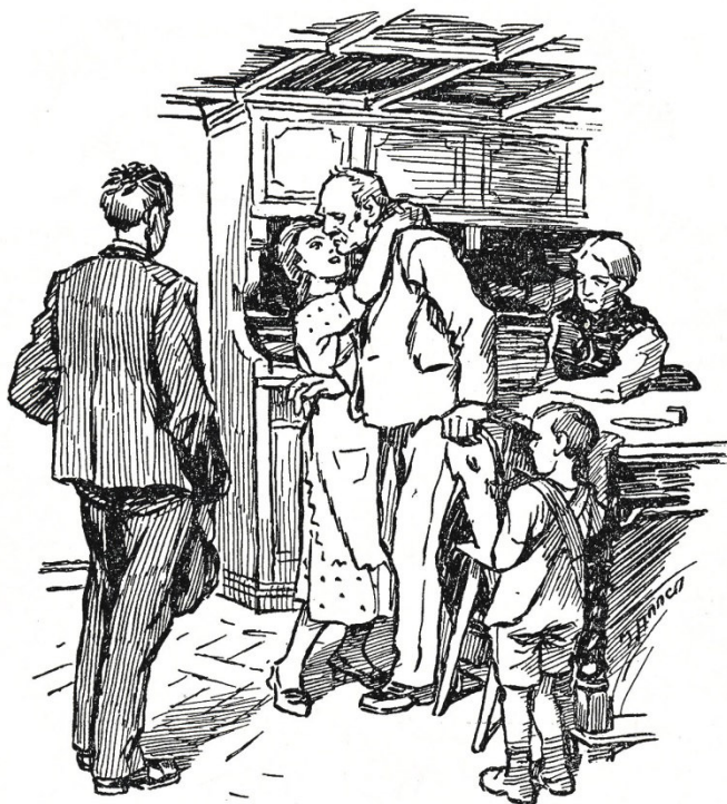
„Vater, sag Ja, sag um Gotteswillen Ja!“

In der Familie der Braut fanden sich alle um den Tisch beisammen. Auch der Geissbub war dabei, schlamsete voll Entzücken