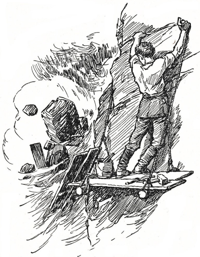
Friedl klammerte sich an die eingemauerten Eisen.

lauter und weil nirgends her eine Antwort kommt, schreit er mit aller Kraft und immer wieder. Dohlen antworten mit Krächzen. Dann erinnert er sich, wie Älpler ihm erzählt haben, dass man sein Hämmern und Klopfen an der Felswand manchmal bis weit in eine entlegene Alp vernommen habe. Er dreht sich um, sucht nach Meissel und Hammer, schlägt dass die Splitter fliegen und ruft dazwischen.