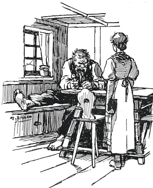
„So, kommst endlich mit dem Geld!“

noch von der Gemeinde erhalten werden. Ich will mein Geld und zwar jetzt gleich und sonst will ich nichts von euch. Her damit!“ Vrenili ging einen Schritt auf den Tisch zu. „Die Mutter ist krank und kann keinen Doktor haben wegen den Kosten. Vater sagt, er habe keinen Rappen mehr. Habt doch ein Einsehen, Herr, bald sind die Kinder grösser, und Mutter wieder gesund und im Herbst können wir eine Kuh verkaufen, dann bringe ich alles, soviel wir schuldig sind.“ Vrenili sagte das mit zitternder Stimme und schaute dazu mit seinen grossen, schönen Augen voll Tränen auf den harten Mann. Der stand endlich auf und trat