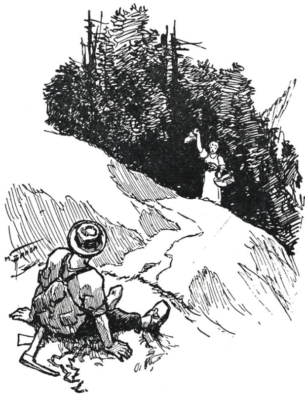
Vrenili winkte mit dem Schuh.

Vom Tobel her ertönt ein Jauchzer, eine helle, klare Mädchenstimme. „Jetzt lachen sie mich noch aus“, denkt der Bärtel und weiss erst recht nicht was tun. Und wieder hört er das Jauchzen zusammen mit dem Brausen des Wildbaches im Tobel und hört die Mädchenstimme rufen: „Ich bringe den Schuh.“ Jetzt jauchzt der Bärtel auch, zum Zeichen, dass er verstanden hat, setzt sich an den Wegrand und wartet und schaut, was da kommen soll.