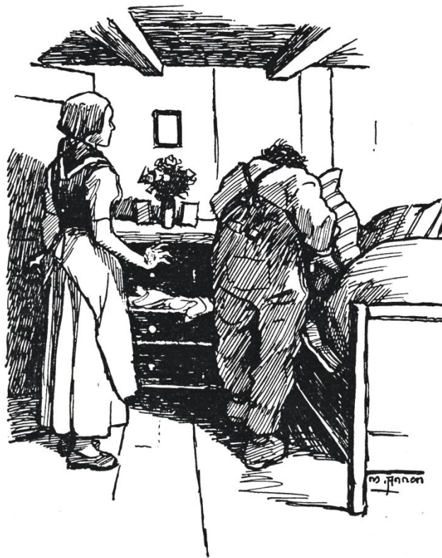
Der Melk untersuchte Vrenilis Kämmerlein.

Natürlich blieb dem Melk, der ein paar Stunden später zurückkam, keine andere Wahl, als entweder Lärm zu machen und sich zu verraten, oder bis zur Zeit, da das Haus geöffnet wurde, draussen zu bleiben. Das tat er dann auch. Er blieb beim Vieh. Vrenili aber wollte seine Rache noch etwas auskosten.