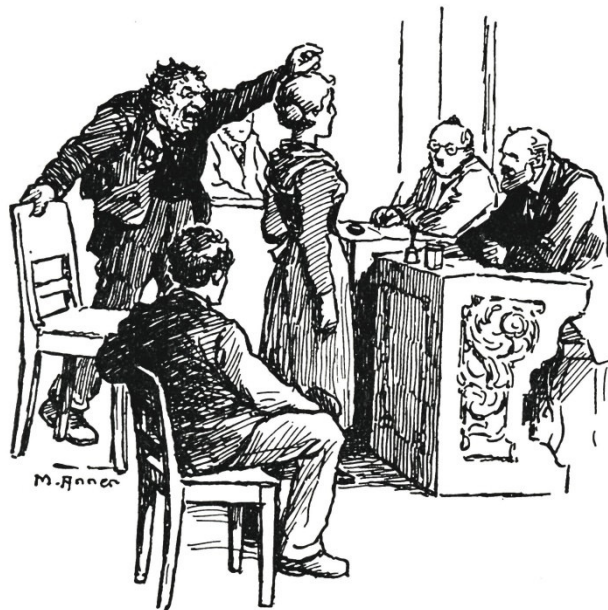
Da schauen alle von den Pulten auf.