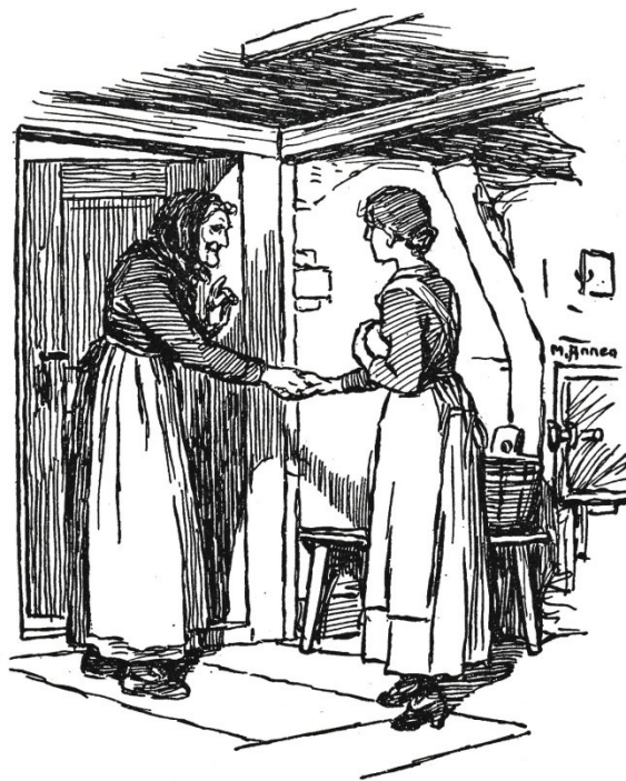
„Still, er schläft!“ sagte die Mutter.

Mit einem Paket Zwieback unter dem Arm trat es schüchtern in die Haustüre.