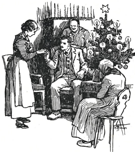
Er nahm ein Ringlein und steckte es dem lieben Mädchen an den Finger.

Da zog Klaus ein kleines Schächtelchen aus der Hosentasche. Es war schön in Sei-