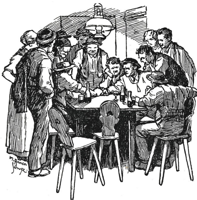
Dann setzten sie die Faust einander entgegen auf den Tisch.

Klaus kam eigentlich zu früh und zu spät heim. In seinem ungeheizten Zimmer oben blieb er schlotternd und zähneklappernd